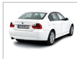
Vue d'angle à 45° de derrière