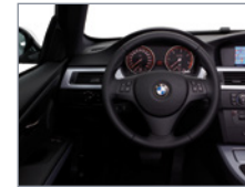
Gros plan - Volant