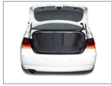
Vue du coffre (éventuellement avec la roue de secours)