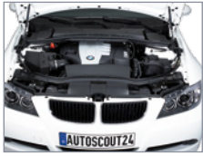
Vue du compartiment moteur

Pour un meilleur résultat, utilisez de préférence le flash pour photographier le moteur et le coffre. Pour une photographie détaillée des jantes, mettez les roues droites.