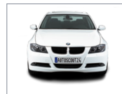
Vue de devant