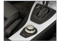
Point de vue différent de l'habitacle Navigation