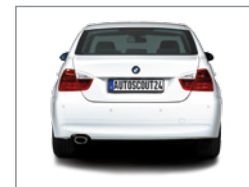
Vue de derrière