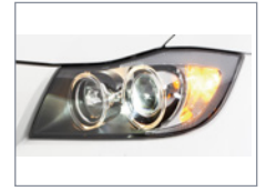
Gros plan - Phare