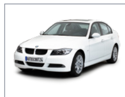
Vue d'angle à 45° de devant

Le véhicule doit être visible sous tous les angles et être éclairé uniformément. Pour prendre une photo de biais, tournez légèrement les jantes vers l'objectif. Lorsque vous photographiez le véhicule de face, de côté ou de derrière, vérifiez que les roues soient droites.