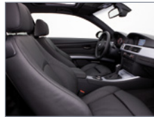
Vue de l'habitacle de côté