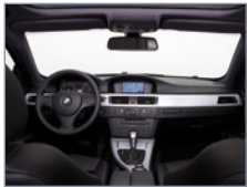
Vue de l'habitacle de devant