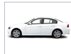
Vue du côté gauche