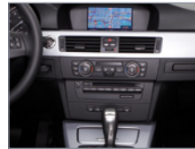
Gros plan - Infodivertissement