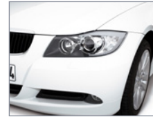
Gros plan - Phare et jante