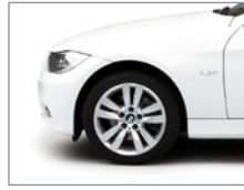
Gros plan - Jantes